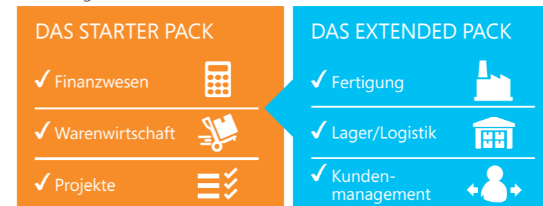
Abbildung 2: Starter Pack und Extended Pack – Funktionalität

Beide Lizenzmodelle wurden für größtmögliche Einfachheit im Kaufprozess konzipiert. Kunden können zwischen zwei Nutzertypen auf Basis von Concurrent Users, das heißt nicht namensgebundenen Benutzern, wählen: Limited User und Full User. Zudem können sie bei umfassenderen Anforderungen den Zugriff dieser Nutzer auf das Extended Pack lizenzieren.