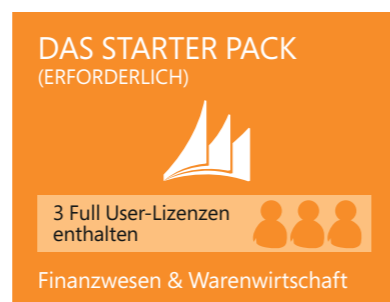
Abbildung 3: Starter Pack

Für viele Unternehmen sind die Funktionalitäten in dieser Lizenzkomponente bereits ausreichend.