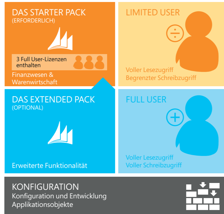
Abbildung 1: Perpetual Licensing im Überblick

Das Lizenzmodell Perpetual Licensing für Microsoft Dynamics NAV 2015 unterstützt mittelständische und kleine Unternehmen beim unmittelbaren, kostengünstigen Einstieg in die Bereiche Finanzwesen und Warenwirtschaft und ermöglicht ihnen, nach und nach weitere Bereiche einzubeziehen. Bei Perpetual Licensing lizenzieren Sie die Funktionalität der ERP-Lösung, und der Zugriff auf diese Funktionalität wird mittels Nutzerlizenzen sichergestellt.